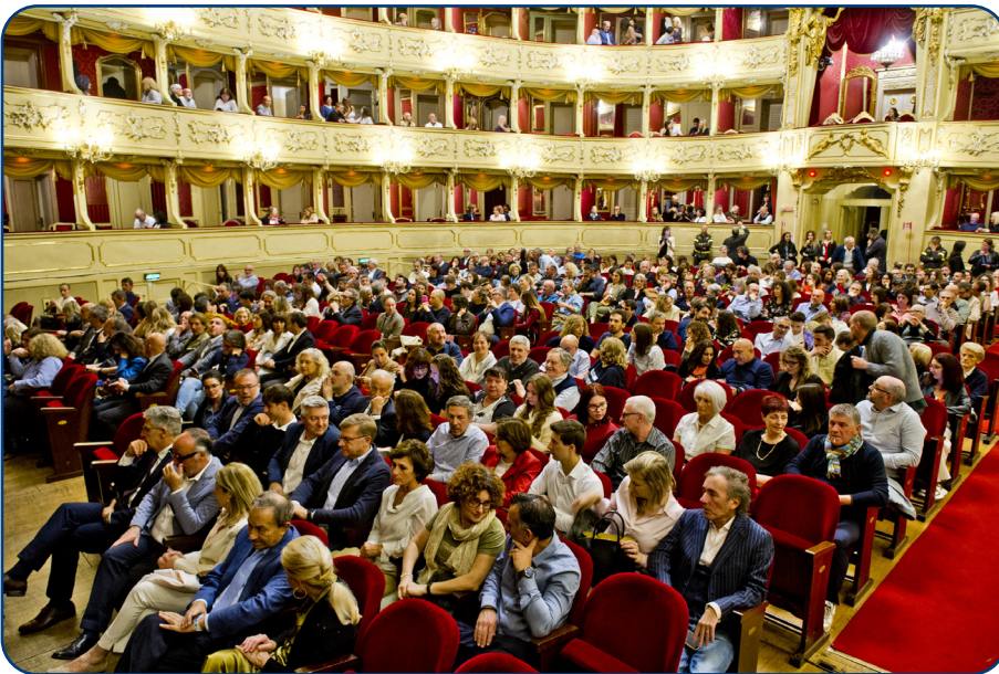
Ale & Franz

Il terzo evento per l'ottantesimo anniversario si è tenuto al Teatro Sociale. Il duo comico Ale & Franz ha saputo conquistare il pubblico con la propria inconfondibile ironia, proponendo una selezione degli sketch più celebri e regalando momenti di pura allegria. La performance ha trasformato la serata in un'esperienza unica, capace di unire generazioni diverse sotto il segno della risata e del divertimento. Numerose le Autorità e gli Associati che hanno condiviso un'esperienza unica all'insegna della convivialità. Al termine dello spettacolo, ogni ospite ha ricevuto un cadeau a ricordo tangibile di una serata che resterà impressa nella memoria di tutti. Le fotografie scattate durante l'evento hanno catturato i sorrisi e i volti degli Associati, simboli delle aziende che, di generazione in generazione, hanno contribuito alla storia e alla crescita di Confcommercio Como. Queste immagini raccontano storie di persone che, con il loro impegno quotidiano, sono i veri protagonisti della nostra grande famiglia. La serata è stata allietata da un momento divertente con Ale & Franz insieme al direttore Graziano Monetti ; hanno salutato il pubblico dal palco, ringraziando tutti gli Associati presenti e anticipando future sorprese e iniziative.