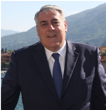
Fiorenzo Bongiasca - Presidente Provincia di Como

Confcommercio Como ha aderito alla rete di supporto del progetto "Lario: creatività e attrattività per l'occupazione", che vede la Provincia di Como capofila, e che sarà presentato alla Regione Lombardia in risposta all'Avviso Pubblico per il finanziamento di Patti Territoriali per le competenze e per l'occupazione – seconda fase – attrattività e nuova occupazione. L'obiettivo principale dei Patti Territoriali è coinvolgere una varietà di attori locali, tra cui enti pubblici, istituti educativi, imprese e associazioni, per sviluppare strategie e azioni volte a migliorare sia il sistema formativo che occupazionale del territorio di Como in particolare nel settore TURISMO. Questi patti mirano a creare percorsi di formazione più aderenti alle necessità del mercato del lavoro locale, facilitando l'inserimento professionale dei disoccupati, sia giovani che adulti e sostenendo la crescita delle imprese. L'obiettivo finale è quello di potenziare la competitività e il benessere socio-economico della provincia di Como, attraverso una stretta collaborazione e sinergia tra tutti i soggetti coinvolti.