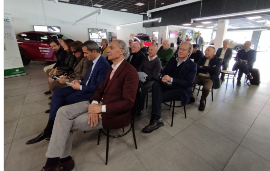
Gli agenti di commercio riuniti in assemblea