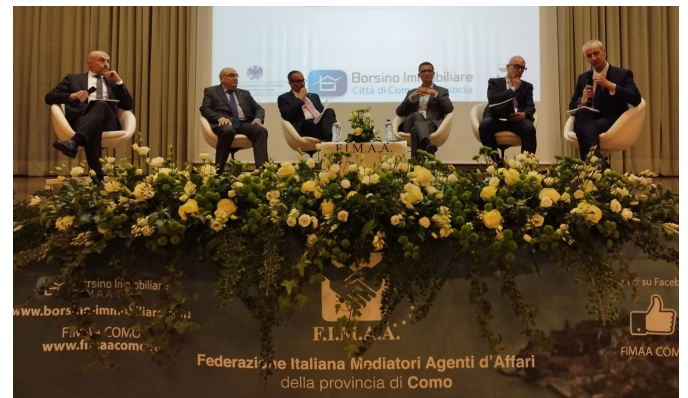
Il momento della tavola rotonda