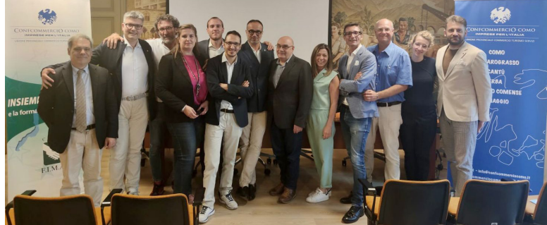
I componenti del nuovo Direttivo Fimaa Como