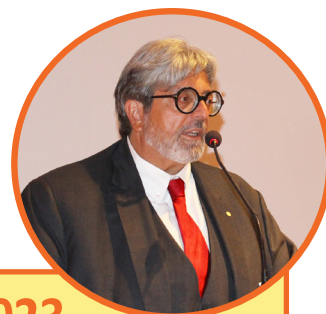
Il Presidente Giovanni Ciceri

Finalmente Confcommercio é riuscita ad ottenere dal gruppo STELLANTIS l'estensione della convenzione anche alle persone fisiche NON in possesso di una partita IVA. Pertanto anche le strutture ricettive extra alberghiere senza partita iva potranno accedere purché in possesso di una tessera associativa Confcommercio o della Confcommercio Card. Importanti sconti sui marchi FCA, Citroen, Peugeot, Opel e molti altri. Una volta in possesso della tessera associativa, è possibile procedere autonomamente alla configurazione e alla prenotazione dell'automobile online, inserendo i codici sconto riservati a Confcommercio che possono essere richiesti chiamando lo 0312441 o scrivendo a info@confcommerciocomo.it . Successivamente, l'Associato dovrà recarsi presso il concessionario da lui individuato, mostrare la tessera/card e completare l'acquisto tramite la piattaforma on line, con un consulente di vendita dedicato, che lo supporterà nella nuova esperienza. •